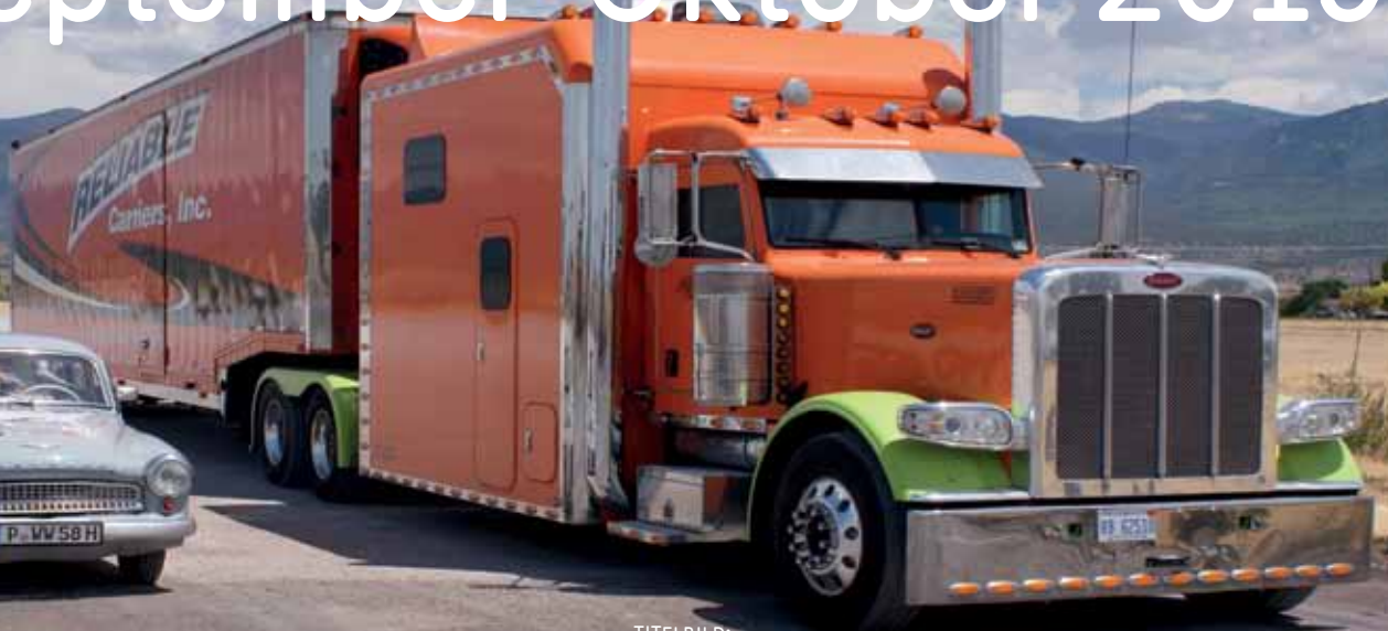
TITELBILD: Mit dem Wartburg durch die USA - ein Vortrag, Fr. 18.10., 20 Uhr, Saal